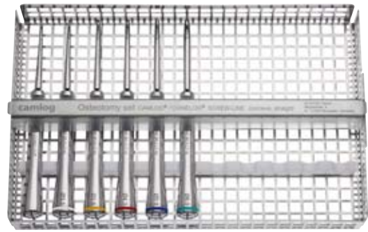
Osteotomie-Set CAMLOG®/CONELOG® SCREW-LINE, gerade