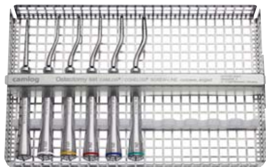
Osteotomie-Set CAMLOG®/CONELOG® SCREW-LINE, anguliert